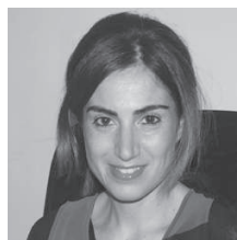
Antonella Giordano Ufficio Stampa Credit Village